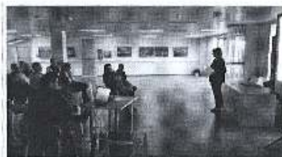
Slika. Nacionalni program sporta sa propadajućim nacionalnim akcijskim planom.

Ad. 6) Športska zajednica u suradnji sa Upravnim odjelom za kulturu i šport Grada Zadra je organizirala radionicu Nacionalni program sporta sa propadajućim nacionalnim akcijskim planom. Predavanje je održano 18. travnja 2018 u Športskom centru Višnjik d.o.o. uz sudjelovanje oko 60 tak udruga sa područja Zadarske, Ličko senjske i Šibensko kninske županije.