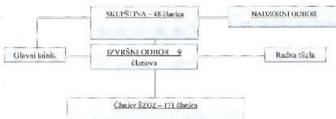
Organigram br. 1 Organizacijski ustroj Športske zajednice Grada Zadra