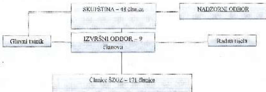
Organigram br. 1. Organizacijski ustroj Športske zajednice Grada Zadra