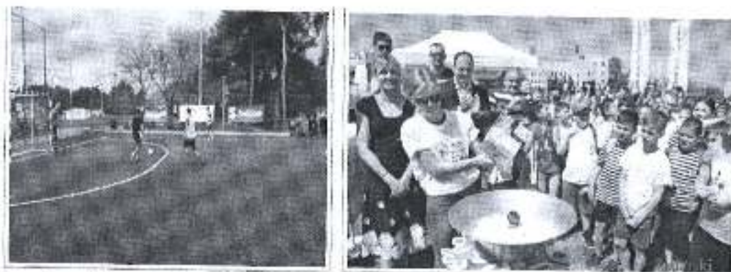
Slika „Sportske igre mladih 2018“ - turniri u malom nogometu i turneja radosti.