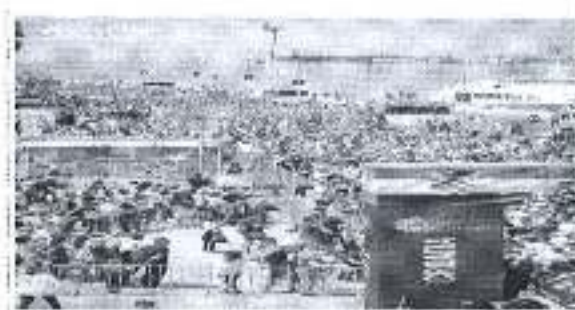
Slika. Wings for Life World run – Zadar 2018.

Ad. 4) Kao i brojni sportski subjekti u Gradu Zadru, Športska zajednica je dala jedan mali doprinos u organizaciji utrke Wings for Life World Run u Zadru gdje je u jednom danu tisuće ljudi trčalo, tisuće kilometara i imali su jedan zajednički cilj – malim doprinosom učiniti svijet boljim odnosno osigurati sredstva za pronalaženje lijeka za liječenje leđne moždine. Dana 6. svibnja 2018. u 13 sati po hrvatskom vremenu globalna utrka Wings for Life World Run započela na nekoliko desetaka lokacija diljem svijeta, pa tako i u Gradu Zadru, gdje je sudjelovalo 8500 trkača.