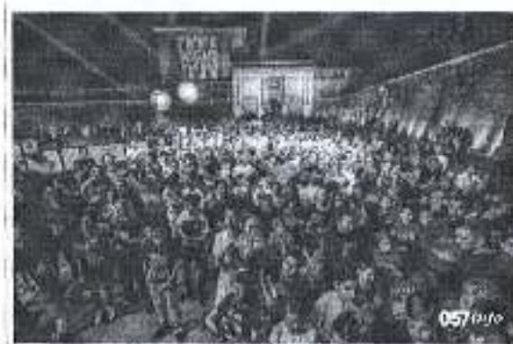
Slika. Zadar night run 2018.

Ad. 2) Športska zajednica je sudjelovala u promociji tradicionalne utrke Zadar Night Run u organizaciji Škole trčanja Zadar i Triatlon kluba Zadar koja je održana 21. travnja 2018. sa početkom u 21.00. Trčalo se kroz ulice povijesnog dijela Zadra, a natjecatelji su mogli izabrati između utrka od 2,5 km, 5 km i 10 km. Sudjelovalo je oko 1100 natjecatelja u svim kategorijama.