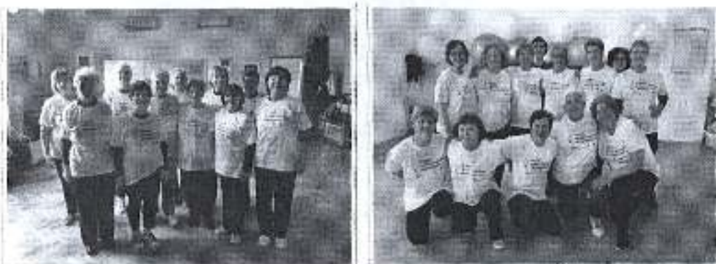
Slike. Program Sportska rekreacija za umirovljenike u Mjesnim odborima Jazine II i Stanovi.

odbora gdje je bilo potrebno osigurati sredstva za plaćanje termina u sportskim dvoranama u iznosu od 12.421,00 kuna.