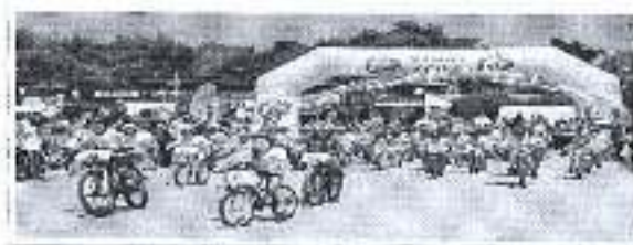
Slika. Biciklistička utrka Dukat fit -Zadar 2018

Ad. 7) U sklopu marketinške strategije Športska zajednica je sudjelovala u pripomoći pri organiziranju 2. Biciklističke utrke Dukat fit i Dukatino za djecu koja se održala 19. svibnja 2018. Cilj utrke koje organizira Dukat mliječna industrija je promicanje urbanog biciklizma kao ekološkog prihvatljivog načina prijevoza te brige o zdravlju i zdravim navikama djece i odraslih