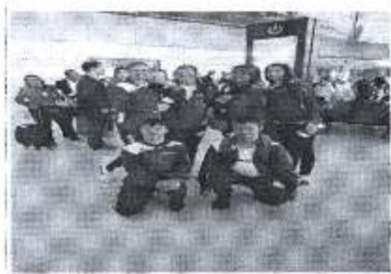
Slika. Svjetsko prvenstvo za sportaše osoba s Down sindromom Madeira 2018.