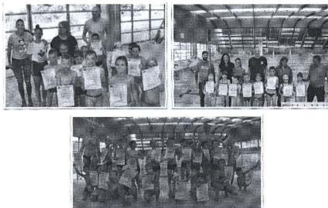
Slike „Obuka neplivača u školama“ 2018. godini.