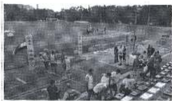
Slika. Državno prvenstvo u atletici za veterane- Zadar 2018.

Ad. 8) U sklopu promocije zadarskoga sporta Športska zajednica je podržala organizaciju Državnog prvenstva u atletici za veterane koje je održano u Športskom centru Višnjik 15 i 16. lipnja 2018. godine, koje je organizirao Klub atletskih veterana Zadar,