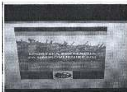
Slika: Programi sportskog izdavaštva.

Iznos odobrenih sredstva planom za 2018. u navedenom programskom području iznosio je 8.000,00 kuna, a program je u cijelosti realiziran sredstvima u iznosu od 11.889,00 kuna, sukladno Odluci IO ŠZGZ.