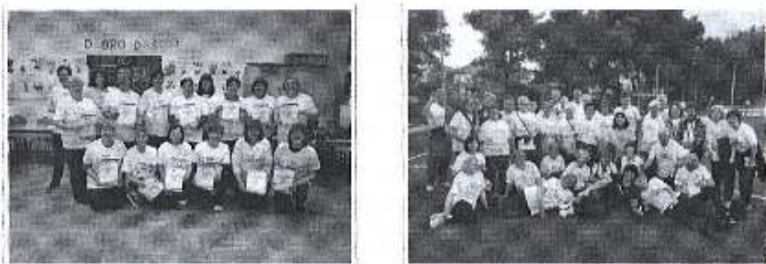
Slike. Program Sportska rekreacija za umirovljenike u Mjesnim odborima Arbanasi i Kožino.