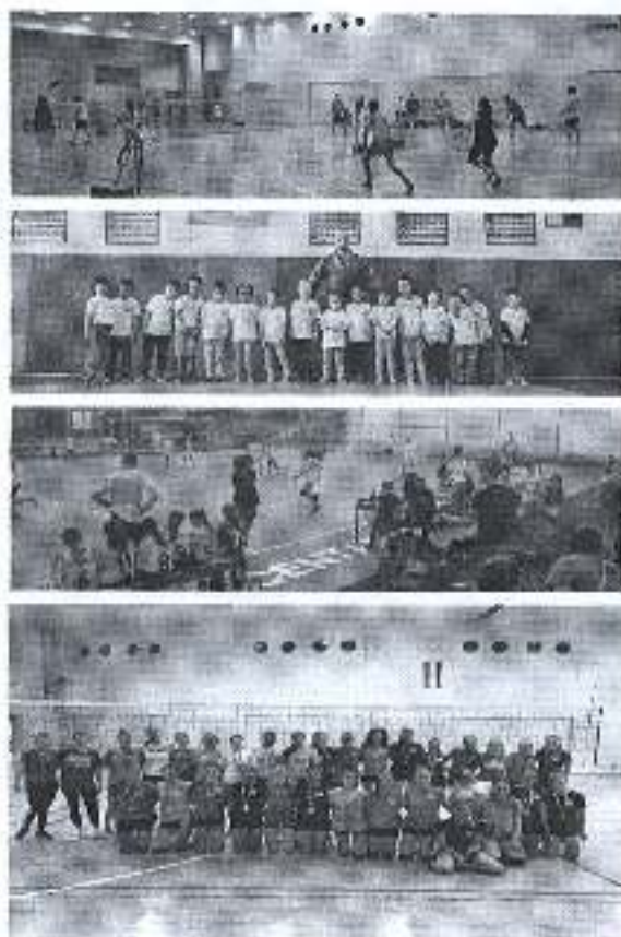
Slika. Provedba programa „Otvoreno prvenstvo Grada Zadra“ za 2018. godinu.