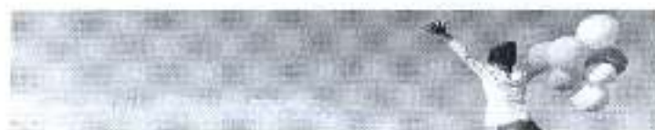
Slika. Donacijski natječaj Otp banke d.d. Zeleno svijetlo 2018.

natječaju Zeleno svijetlo za bolje društvo u iznosu od 4.000,00 kuna za program male škole u području sporta. Na natječaj je pristiglo više od tisuću i sedamsto prijava iz cijele Hrvatske, a natječajno povjerenstvo odabralo je 47 projekata, koji su se istaknuli svojom kvalitetom te jasnim doprinosom društvu, a posebno zajednici koja je projektom obuhvaćena, i Središnjeg državnog ureda za šport, za program obuke neplivača.