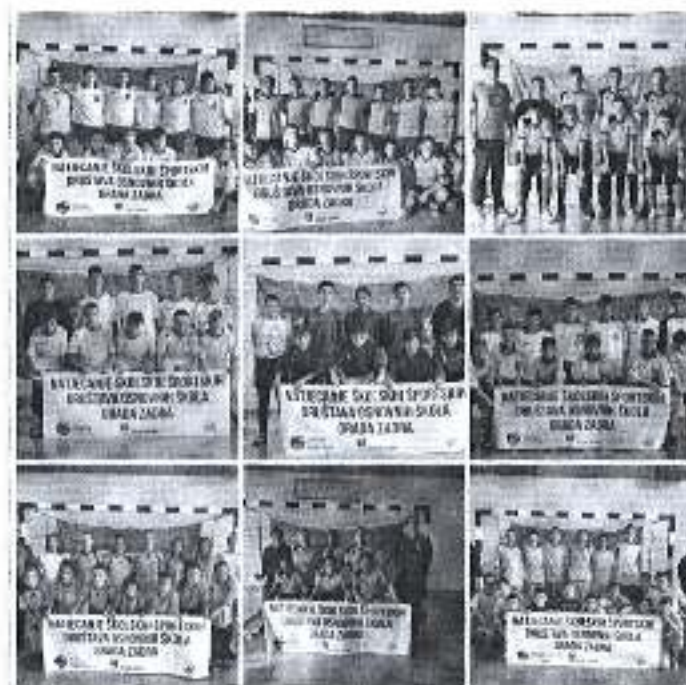
Slika. Školski sport – školska godina 2018-2019.