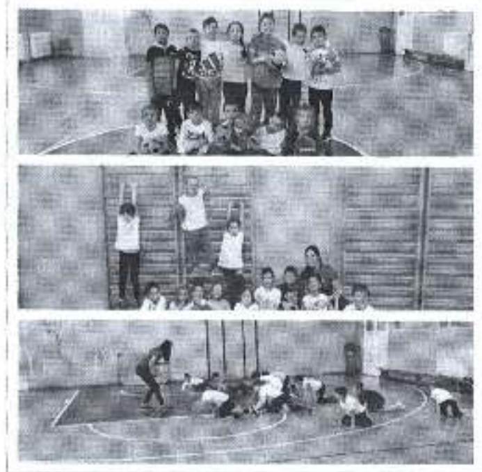
Slika. Program male sportske škole.

Ukupan iznos odobrenih sredstva planom za 2018. u navedenom programskom području iznosio je 15.000,00 kuna, te je program u realiziran u iznosu od 13.958,00kuna, dok su preostala neutrošena sredstva u iznosu od 1.042,00 kuna prenamijenjena sukladno odluci IO ŠZGZ.