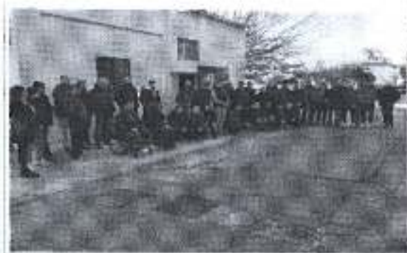
Slika. Zadarski sportaši u akciji prikupljanja potrepština za socijalnu samoposlugu.

Ad. 13) Dana 15. prosinca 2018. godine na Zadarskoj rivi, sa startom i ciljem kod morskih orgulja, Klub atletskih veterana Zadar u suradnji sa školom trčanja Zadar, Atletskim savezom Zadarske Županije, Triatlon klubom, Športskom zajednicom organizirao je treću atletsku utrku štafeta 4 x 100 metara, koja je imala humanitarni karakter, gdje su se prikupljena sredstva donirala Socijalnoj samoposluzi u Zadru, Odaziv sudionika je bio zadovoljavajući, te se očekuje nastavak ove prigodne i hvale vrijedne manifestacije i iduću godinu.