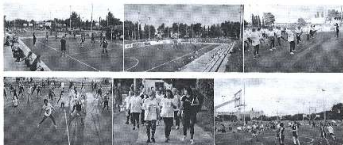
Slika. Wings for Life Warm Up - Dani otvorenih vrata ŠC Višnjik d.o.o.

20.00 sata održan koncert grupe „Indira forza“, zadarskoga banda „Hot stuff“. U subotu od ranih jutarnjih sati sportske udruge su predstavile svoje programe i trenažne aktivnosti u niz sportova, nogomet, košarka, odbojka, judo, hrvanje, karate, sportsko penjanje, gimnastiku itd.