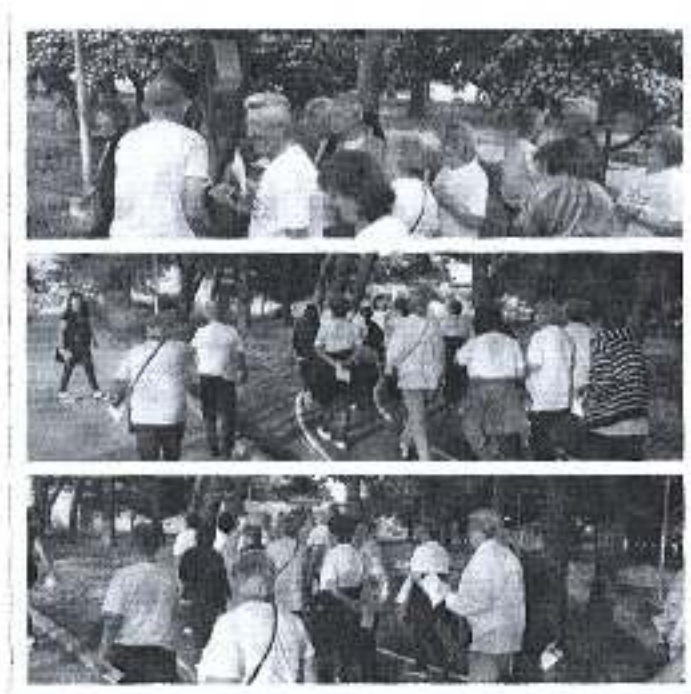
Slika. Program orijentacijskog kretanja 2018.- svibanj 2018.