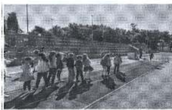
Slika. Olimpijada za pet 2018.

Ukupan iznos odobrenih sredstva u navedenom programskom području iznosio je 6.000,00 kuna, te je program realiziran sredstvima u iznosu od 3.112,70kuna, osiguranih Financijskim planom Športske zajednice za 2018., dok su preostala sredstva u iznosu od 2 887,00 kuna prenamijenjena sukladno Odluci IO ŠZGZ.