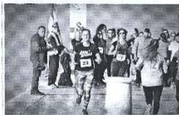
Slika. Humanitarna atletska utrka štafeta 4 x 100 metara.

Ad. 13) Dana 15. prosinca 2018. godine na Zadarskoj rivi, sa startom i ciljem kod morskih orgulja, Klub atletskih veterana Zadar u suradnji sa školom trčanja Zadar, Atletskim savezom Zadarske Županije, Triatlon klubom, Športskom zajednicom organizirao je treću atletsku utrku štafeta 4 x 100 metara, koja je imala humanitarni karakter, gdje su se prikupljena sredstva donirala Socijalnoj samoposluzi u Zadru, Odaziv sudionika je bio zadovoljavajući, te se očekuje nastavak ove prigodne i hvale vrijedne manifestacije i iduću godinu.