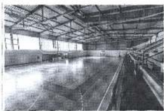
Slika. Programi aktivnosti zajednica – Športska dvorana Slavcine