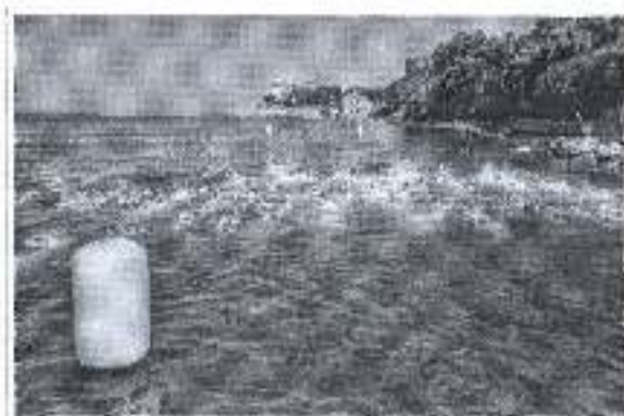
Slika. 12. Državno prvenstvo u plivanju na 5000 metara - Zadar 2018.

Ad. 9) U sklopu promocije zadarskoga sporta Športska zajednica je podržala organizaciju 12. Državnog prvenstva u plivanju koje je održano 07. srpnja 2018. godine u Zadru na bazenu Kolovare.