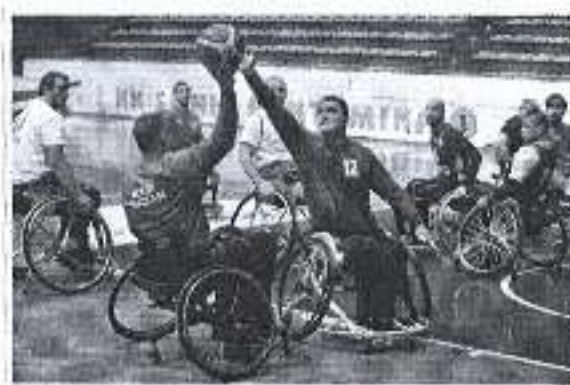
Slika. Program sporta osoba s invaliditetom