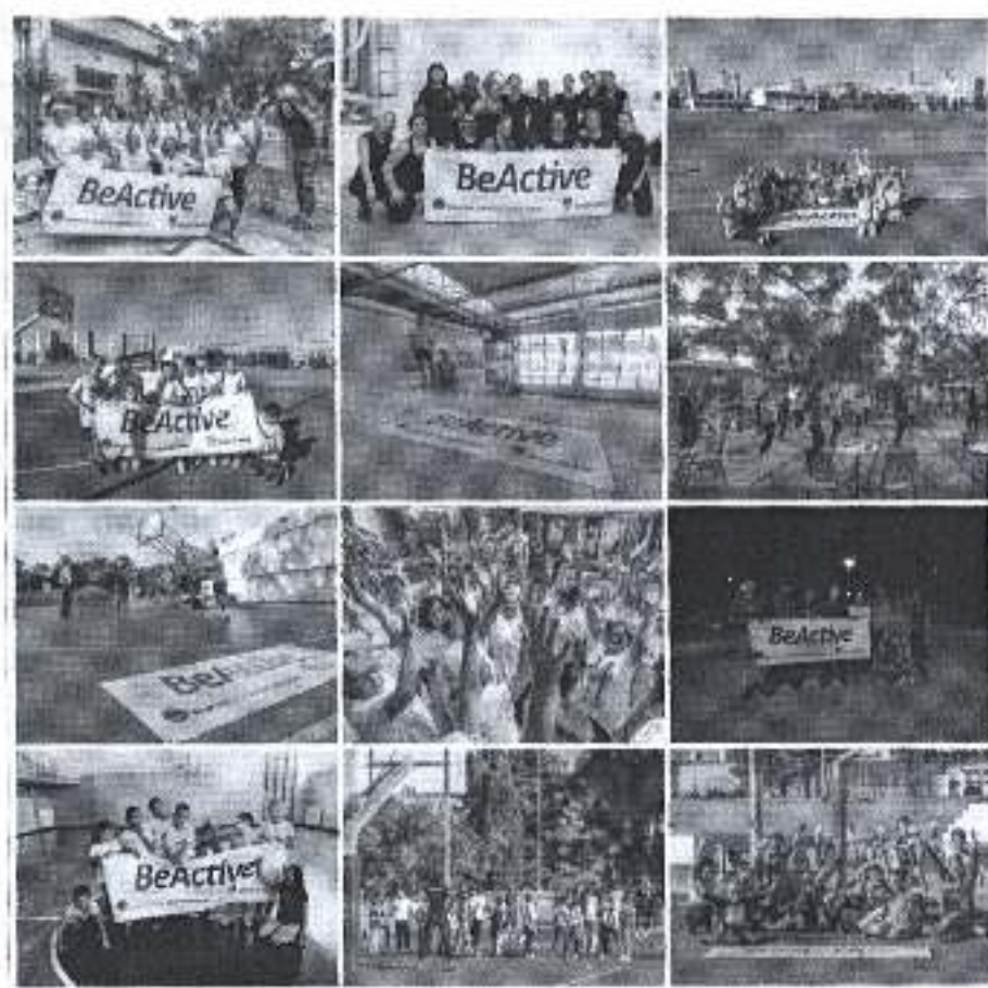
Slika. Obilježavanje Evropskog tjedna sporta u Gradu Zadra 2018.