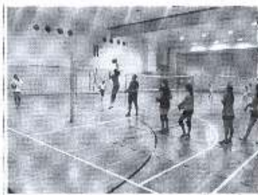
Slika. Program sportskih aktivnosti tijekom školskih praznika.