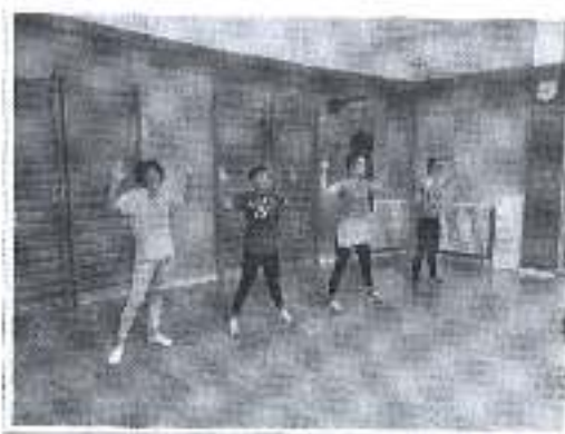
Slika. Tjelesna i zdravstvena kultura za rehabilitaciju autoimunih bolesti.