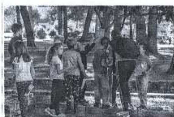
Slika. Program orijentacijskog kretanja 2018.- rujem 2018.