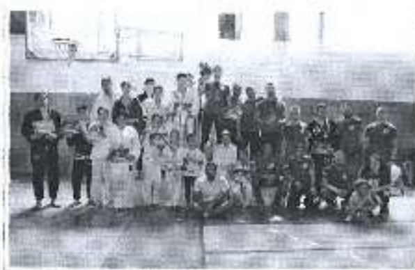
Slika. Obilježavanje Međunarodnog olimpijskog dana u Gradu Zadru.

Ukupan iznos odobrenih sredstva planom za 2018. u navedenom programskom području iznosili je 5.000,00 kuna, te je program u cijelosti realiziran u iznosu od 4.926,00kuna, dok su preostala neutrošena sredstva u iznosu od 74,00 kuna prenamijenjena sukladno odluci IO ŠZGZ.