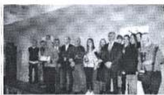
Slika. Dodjela nagrada za najbolje sportaše za 2017.

Ad. 2) Športska zajednica je sudjelovala u promociji tradicionalne utrke Zadar Night Run u organizaciji Škole trčanja Zadar i Triatlon kluba Zadar koja je održana 21. travnja 2018. sa početkom u 21.00. Trčalo se kroz ulice povijesnog dijela Zadra, a natjecatelji su mogli izabrati između utrka od 2,5 km, 5 km i 10 km. Sudjelovalo je oko 1100 natjecatelja u svim kategorijama.