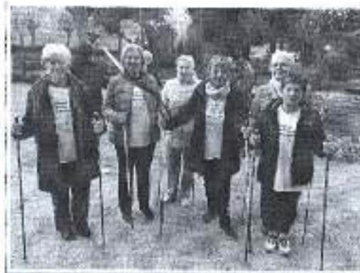
Slika. Program nordijskog hodanja Park Vladimir Nazor.