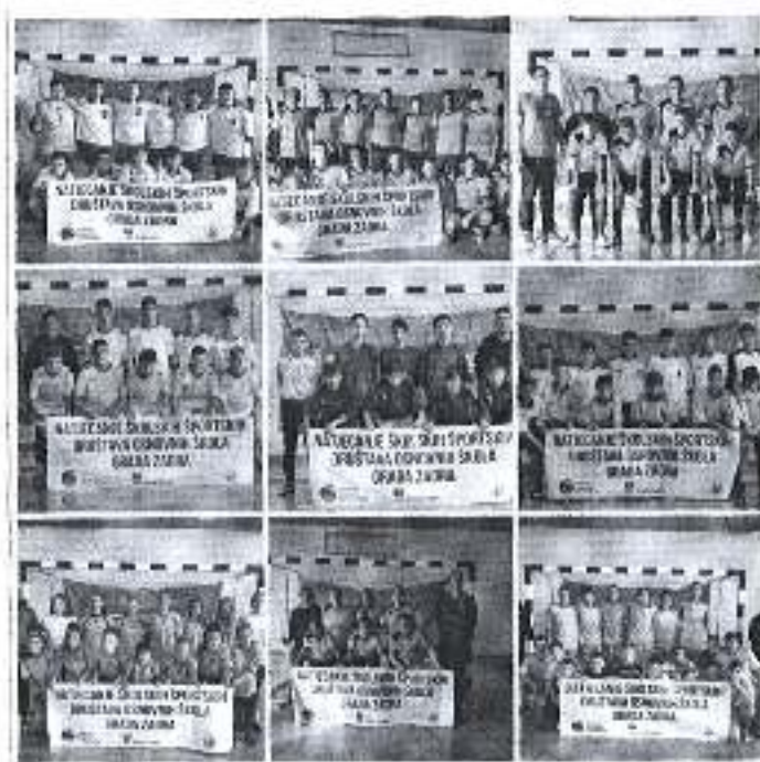
Slika. Športski sport – školska godinu 2018/2019.